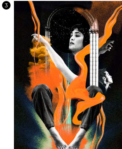
1. FauWst du Collectif Bajour @Nadia Diz Grana