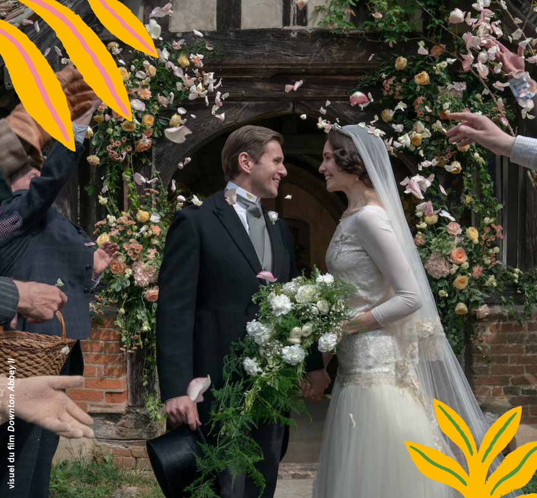
visuel du film Downton Abbey II