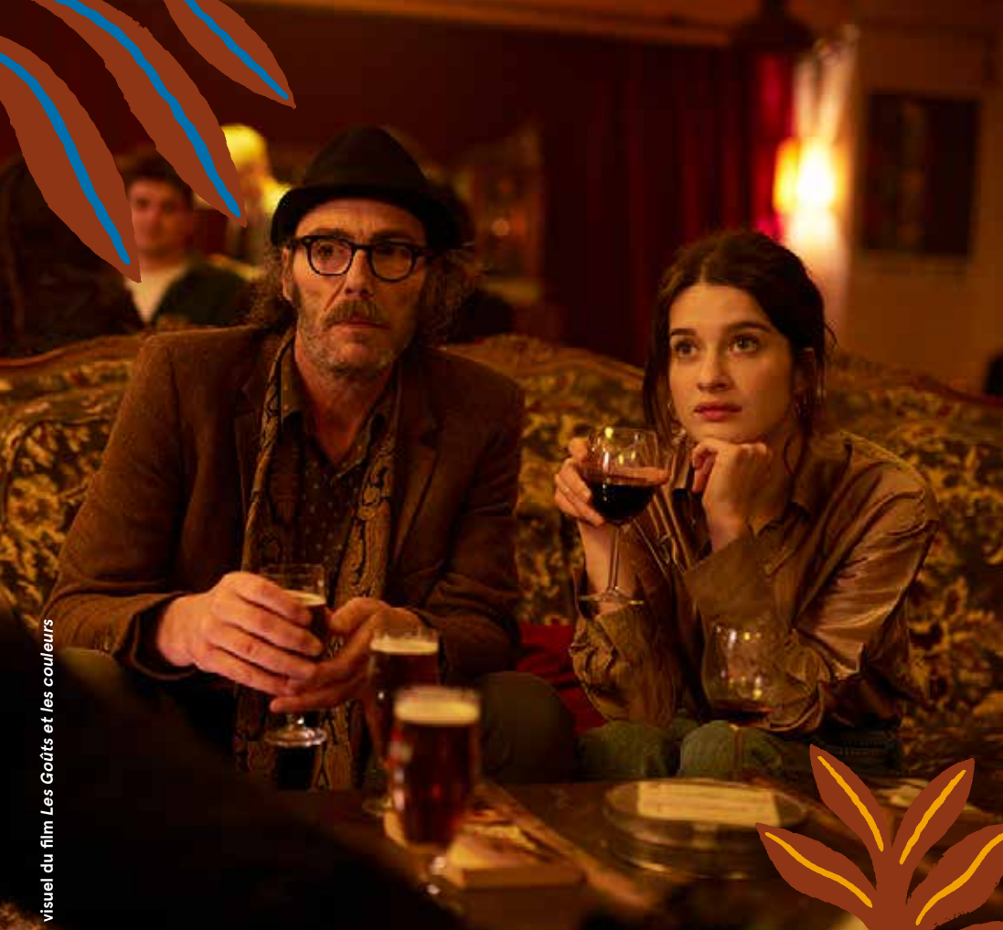
visuel du film Les Goûts et les couleurs