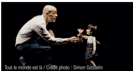
Tout le monde est là

Judi 2 et vendredi 3 novembre de 14h à 17h : ados-adultes, dès 12 ans