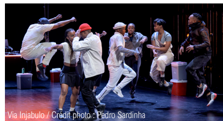
Via Injabulo

Samedi 30 mars de 10h à 13h : parents-enfants, dès 8 ans